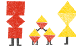
KAKSOS- JA KOLMOSPERHEET