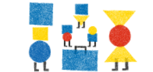
KAHDEN KULTTUURIN PERHEET