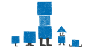
YHDEN VANHEMMAN PERHEET